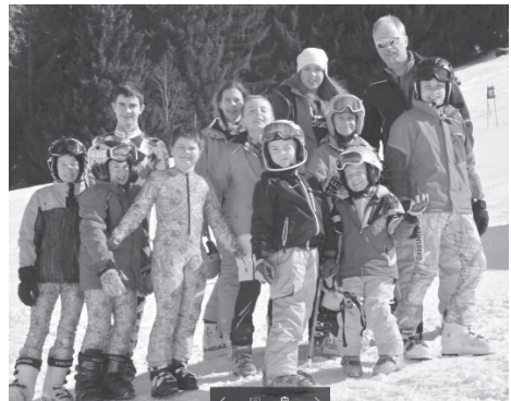
Bild: Rennteam am Balmberg Jugendriesenslalom in Schönried

Für mich schliesst sich mit dem Saisonende ein Kapitel. Ich werde die Verantwortung für die Rennggruppe abgeben und wünsche meinem Nachfolger bereits heute alles Gute und viel Erfolg für die Zukunft. Den Rennfahrer/innen wünsche ich viel Freude und vor allem Schnee, damit Sie noch viele weitere Rennen bestreiten können.